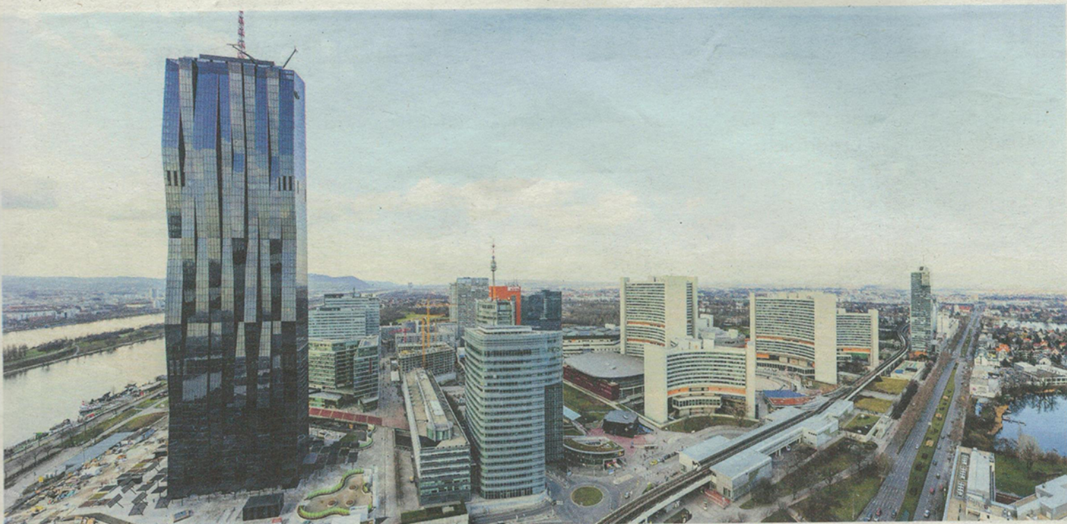
Der DC Tower in Wien gehört zu den größten Projekten in der Gebäudeverwaltung von Caverion

People Flow in Gebäuden sorgen sollen. Dies fängt in der Lobby an und setzt sich bis zum Ziel im gewünschten Stockwerk fort. Dabei werden horizontale und vertikale Verkehrsströme analysiert, Richtlinien zur Orientierung entwickelt und Anlagen sowie Services unter Berücksichtigung der Öko-Effizienz geplant.